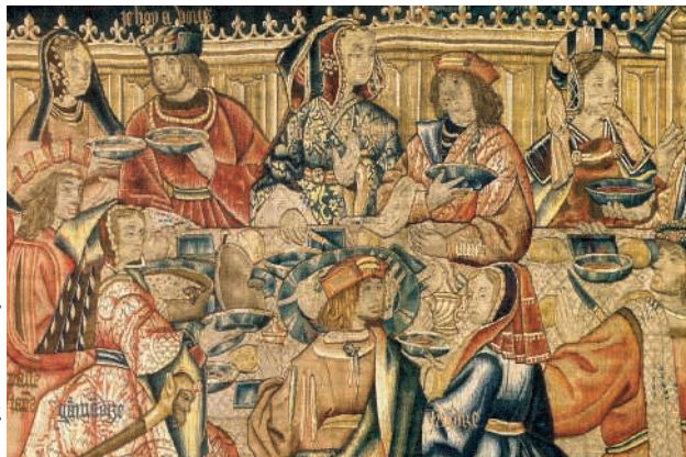
Détail du Repas de Dîner , Atelier de Tournai, 1 er quart du XVI e siècle