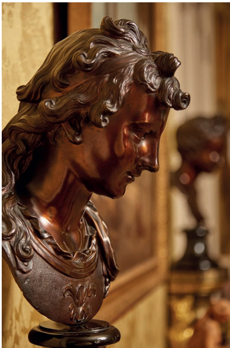
ROBERT LE LORRAIN (1666-1743), DÉBUT DU XVIII E SIÈCLE PAIRE DE BUSTES EN BRONZE REPRÉSENTANT MARS ET VÉNUS Patine translucide mordorée ; reposant sur un socle en marbre noir Hauteur : 38 cm. ; Hauteur totale : 50 cm. 120,000-180,000 €